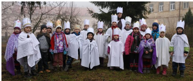
Tříkrálová sbírka 2018

V uplynulém roce bylo v našem skautském oddíle zaregistrováno celkem 65 dětí a dospělých.