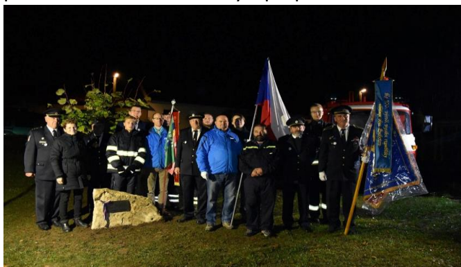
Sázení lípy svobody na návsi