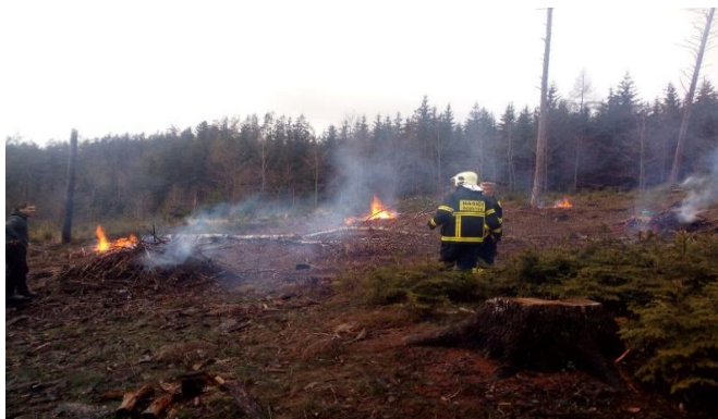
Výjezd zásahové jednotky 23. prosince

V neděli 23. 12. vyjela jednotka k nahlášenému požáru lesa u Pilky směr Kořenec. Na místě členové zásahové jednotky zjistili nenahlášené pálení kletí.