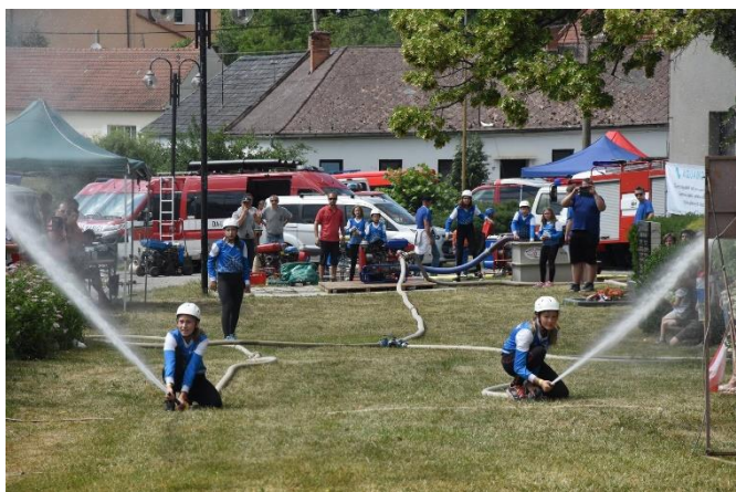
Soutěž malých hasičů a dorostu na návsi

1. května se z iniciativy mladých asi po 60 letech stavěla májka a naše složky byly opět u toho. Mladí nachystali májku, skauti připravili věnec a na