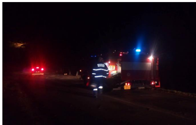
Výjezd zásahové jednotky k padeným stromům směr Kořenec

Dne 23. března zasahovala místní jednotka u požáru v areálu pily. Letní parné a suché počasí se naštěstí obešlo bez nutnosti výjezdu. V pátek