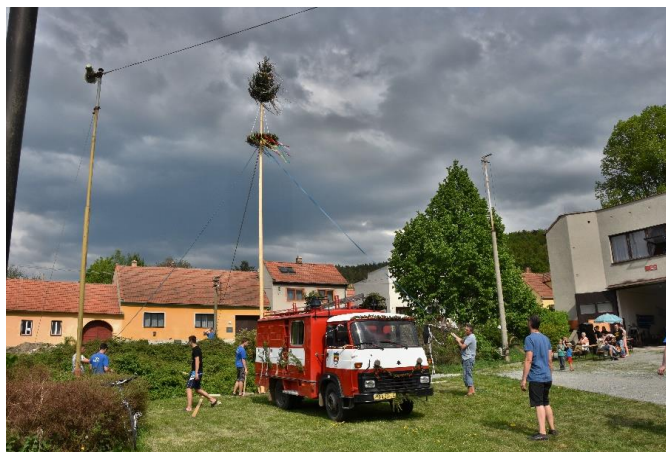
Stavění Máje před hasičskou zbrojnicí

hasičské Avii se vše převezlo. U zbrojnice byly pro malé děti připraveny soutěže a pro malé i velké bylo připraveno občerstvení.