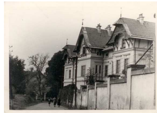
4. Vila ze silnice. (Kolem r. 1950.)