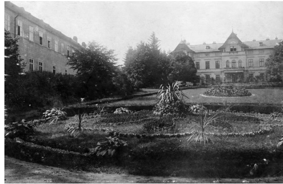
2. Pohled na Vilu od zámku. V místě květinových záhonků je dnes „parket“. (Kolem r. 1915.)