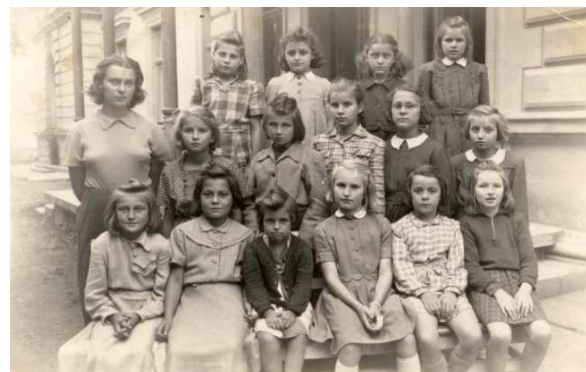
7. Škola v přírodě. Děti z Kobylic. (Kolem r. 1950.)