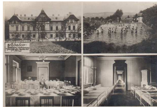
3. Dobová pohlednice. Ozdravovna - celkový pohled, koupaliště v Přídolí, jídelna, ložnice. (Kolem r. 1933.)