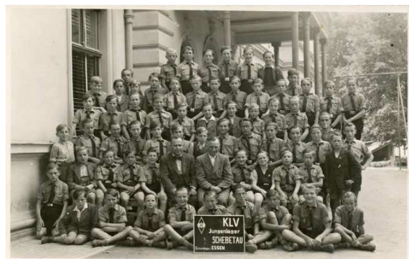
5. Tábor KLV. Chlapci z německého Essenu. (Kolem r. 1943.)