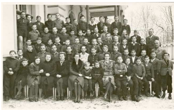
6. Tábor. Zřejmě jde o italskou skupinu chlapců. (Kolem r. 1943.)