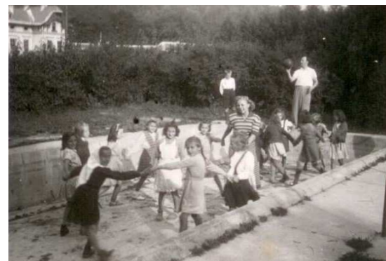
8. Škola v přírodě. Děti z Kobylic u pavilonu. (Kolem r. 1950.)