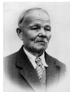
2. Josef Dvořák (*1870 - †1947).