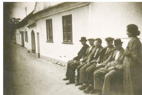
1. Kovárna na čp. 25 (dům v pozadí). Fotografie kolem r. 1955.